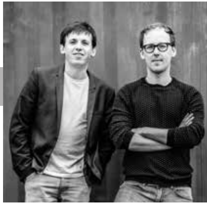
Martens Van Caimere Architecten